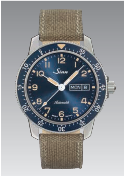
104 St Sa A B E: sandfarbenes Canvas-Lederarmband. Zifferblatt dunkelblau, mit Sonnenschliff veredelt. ø 41 mm (Abb.: 1:1)