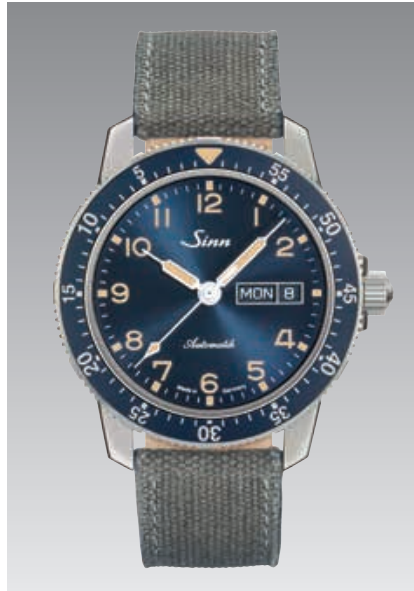
104 St Sa A B E: graues Canvas-Lederarmband. Zifferblatt dunkelblau, mit Sonnenschliff veredelt. ø 41 mm (Abb.: 1:1)