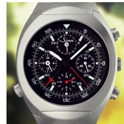
Model 142 St II