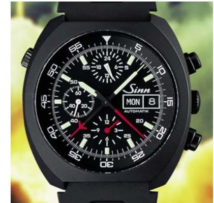
Modell 142 St S