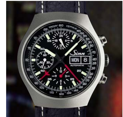
Modell 157 Ti Ty