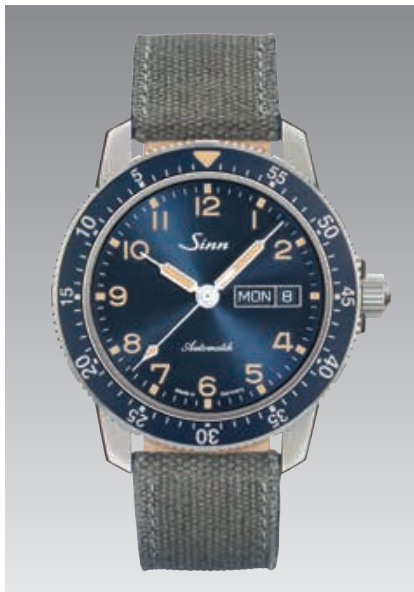
104 St Sa A B E : bracelet en toile et cuir, gris. Cadran bleu foncé rehaussé d'un décor soleillé ø 41 mm (ill.: 1:1)