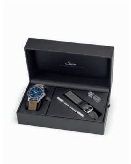
La montre vous est remise dans un élégant étui avec un bracelet en toile et cuir de couleur grise et un autre de couleur sable, un outil permettant de changer de bracelet, des barres de ressort de rechange et un livret.