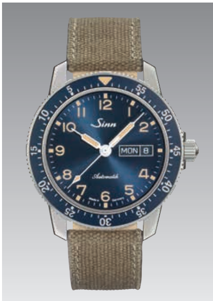
104 St Sa A B E : bracelet en toile et cuir, sable. Cadran bleu foncé rehaussé d'un décor soleillé. ø 41 mm (ill.: 1:1)