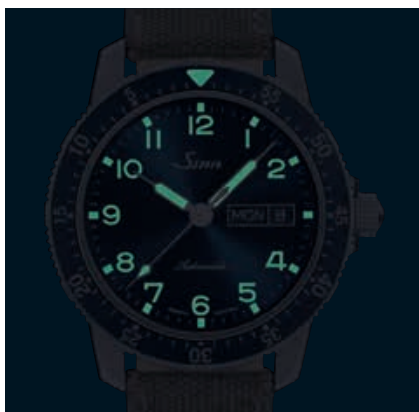
104 St Sa A B E – Éléments luminescents. (ill.: 1:1)