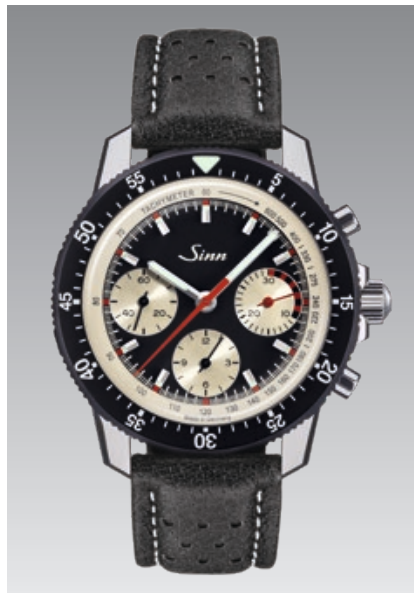
103 St Ty Hd : bracelet en cuir de sanglier noir avec perforations décoratives et couture contrastée blanche qui vire au rouge à la sortie du bracelet, créant ainsi un contraste séduisant. Garantie à 2 ans. ø 41 mm (ill : 1:1)