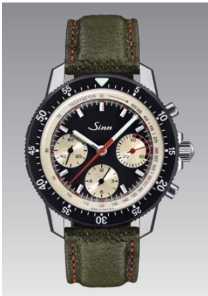
103 St Ty Hd : bracelet en cuir de sanglier vert avec couture contrastée rouge. Garantie à 2 ans. ø 41 mm (ill : 1:1)