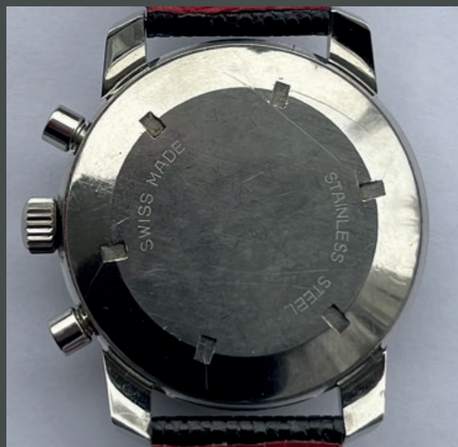
Vue avant et arrière de l'original historique : la 103 C.