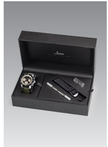
Vous recevrez la montre dans un double étui avec deux bracelets de sanglier en vert et en noir, un outil de changement de bracelet, des barrettes à ressort de rechange et une brochure.