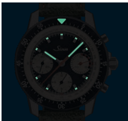
103 St Ty Hd – éléments luminescents. (ill : 1:1)