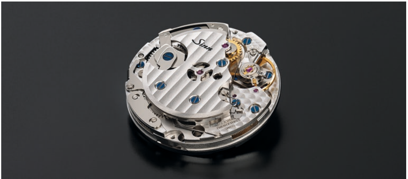
L'édition spéciale limitée 103 St Ty Hd est dotée du mouvement à remontage manuel SW 510 M.

Des index appliqués de grande qualité ornent le cadran noir satiné. Associée aux aiguilles des heures et des minutes rhodiées, la montre déploie un effet d'élégance et reste lisible même dans l'obscurité grâce aux éléments luminescents.