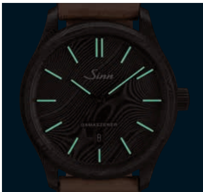
1800 S DAMASZENER – nach(t)leuchtend. (Abb.: 1:1)

So wartet die Uhr mit einer Einzigartigkeit auf, die sich direkt in der Formgebung und Anmutung widerspiegelt. Denn um die charakteristische Textur des Damaszener Stahls – ein organisches Muster von abwechselnd hellen und dunklen Linien – zu nutzen, wird das Zifferblatt zusammen mit dem Mittelteil aus dem vollen Stahlblock gefräst – und nicht wie üblich als separates Bauteil konzipiert. Das Ergebnis kann sich sehen lassen: Denn das Damaszener Muster des Zifferblattes setzt sich auf dem gesamten Gehäuse fort und bildet eine ebenso stimmungsvolle wie spannende Einheit. Durch den Einsatz der TEGIMENT-Technologie und das zusätzliche Aufbringen einer schwarzen Hartstoffbeschichtung gelingt es uns,