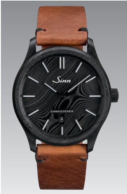
1800 S DAMASZENER mit mittelbraunem Rindslederarmband in Vintage-Optik. ø 43 mm (Abb.: 1:1)