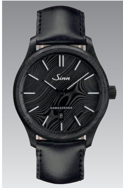
1800 S DAMASZENER mit schwarzem Kalbslederarmband. ø 43 mm (Abb.: 1:1)