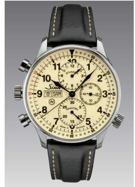
Modell 917 mit Wochentags- und Datumsanzeige