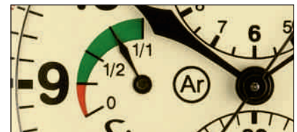
Modell 917 GR mit Gangreserveanzeige

Seit 5 Stunden unterwegs. Die kurvigen Passstraßen erfolgreich bezwungen, bereit für die nächste Wertungsprüfung. Bei einer Rallye kommt es auf höchste Präzision und Funktionalität an. Hier kann der Rallyechronograph 917 punkten. Zum Beispiel mit dem rückwärts zählenden Drehring, der das exakte Einstellen und leichte Ablesen sekundengenauer Zielzeiten erlaubt. Rote Ziffern für die letzten 15 Sekunden erhöhen die Aufmerksamkeit in der kritischen Zeitzone. Auf dem klassischen