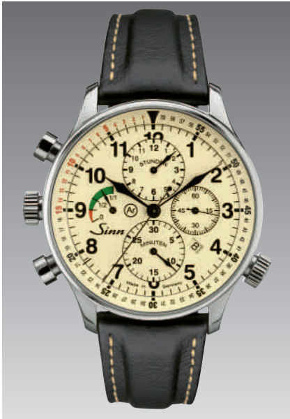
Modell 917 GR mit Gangreserveanzeige