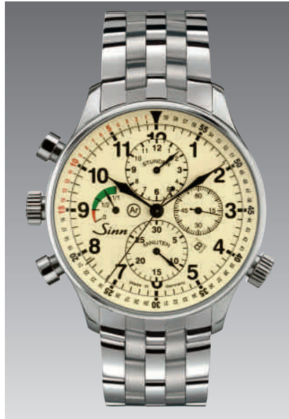
Auf Wunsch mit feingliedrigem Massivarmband