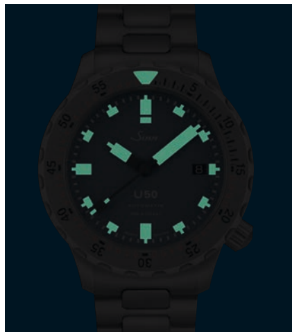
U50 B : éléments luminescents. (ill : 1:1)

Grande illustration au recto : U50 B : bracelet en silicone bleu. Garantie à 2 ans.