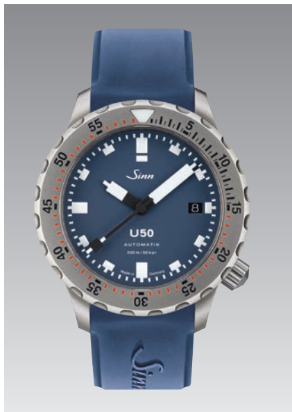
U50 B : bracelet en silicone bleu. Garantie à 2 ans. ø 41 mm (ill : 1:1)