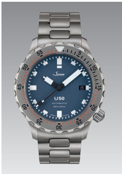
U50 B : bracelet en acier inoxydable massif avec réglage fin de la longueur du bracelet. Garantie à 2 ans. ø 41 mm (ill : 1:1)