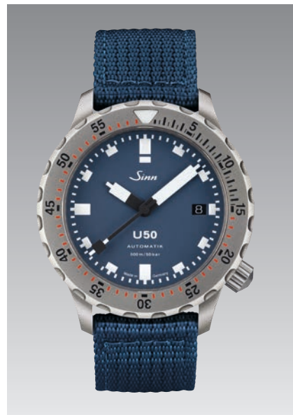
U50 B : bracelet en textile bleu. Garantie à 2 ans. ø 41 mm (ill : 1:1)